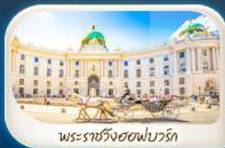
พระราชวังฮอฟบวร์ค

12-18 มี.ค.68 / 19-25 มี.ค.68 28 เม.ย. - 4 พ.ค.68 7-13 พ.ค.68