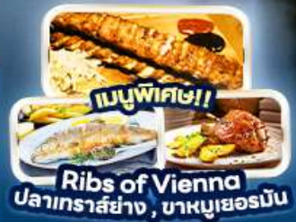
Ribs of Vienna ปลาเทราต์ย่าง, บายูเออร์มัน