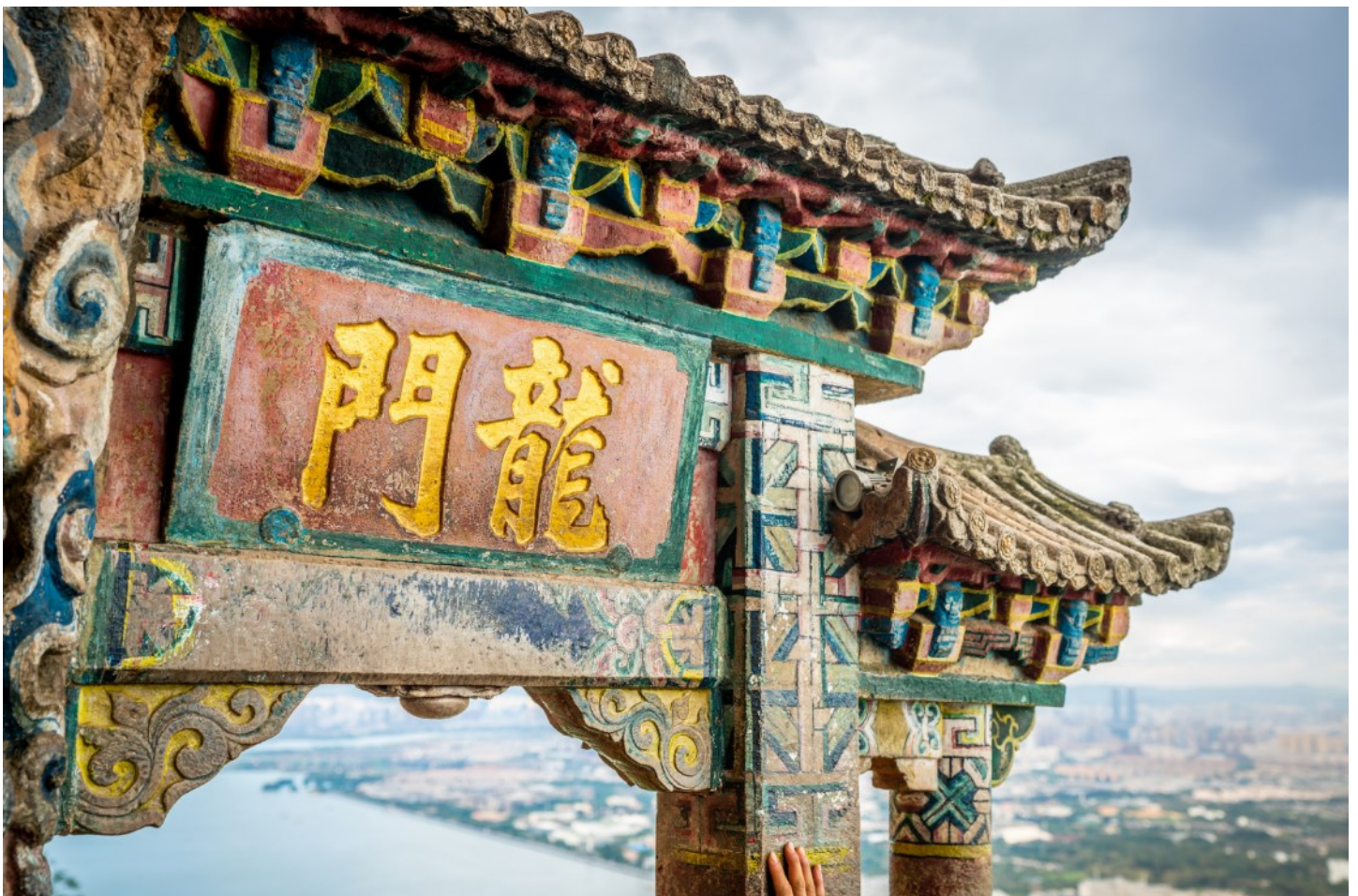
นำท่านพิชิต ยอดเขาชีซาน ภูเขาที่มีประวัติความเป็นมาว่า 1,000 ปี ชมทิวทัศน์อันงดงามของนครคุนหมิง เบื้องล่าง และทะเลสาบเตียนชืออันกว้างใหญ่ที่สุดสายตา ได้รับการขนานนามว่า "ไข่มุกทองแสงแห่งที่ราบ