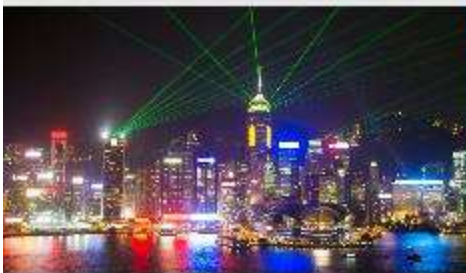
Symphony of Lights