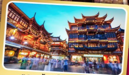
ตลาดร้อยปีฉงหวงเมี่ยว