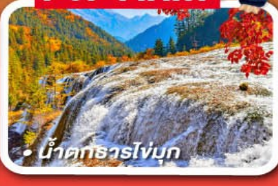
น้ำตกธารโง่บูก