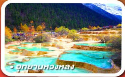
อุทยานหลวงหลง