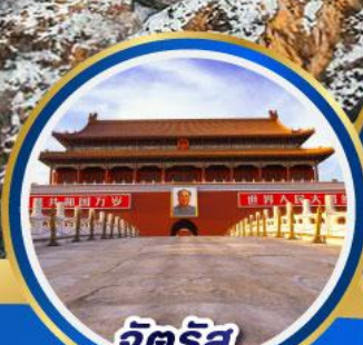
จัตุรัส เทียนอันเหมิน