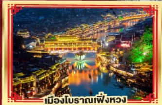
เมืองโบราณเฟิงหวง