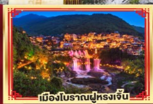
เมืองโบราณฟูหลงเจิน