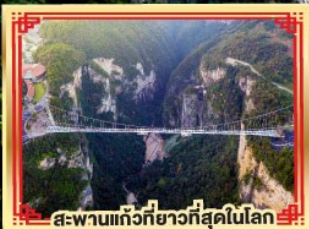
สะพานแกว่งที่ยาวที่สุดในโลก