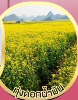
ทุ่งดอกน้ำขิง