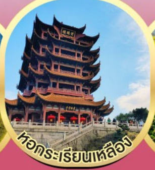
หอกระเรียนเหล็อง