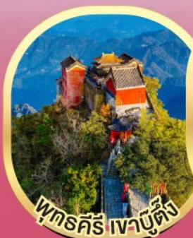
พุทธคีรี เจาบูต้ง