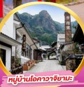
หมู่บ้านโอคาว่าจิยามะ