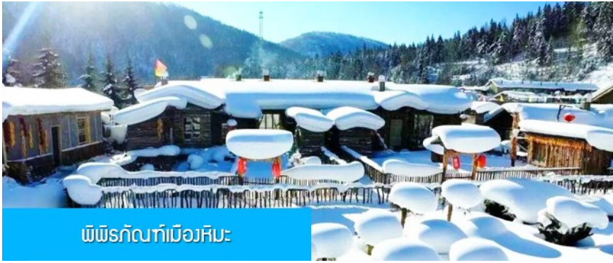
พิพิธภัณฑ์เมืองหิมะ