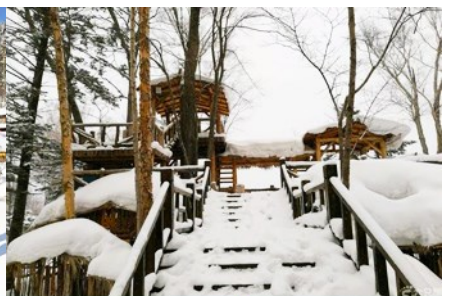
ระเบียงชมวิวยุขาน