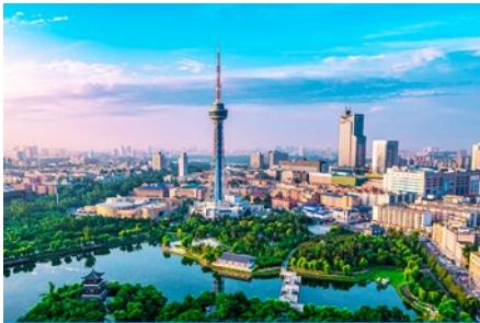
เมืองจีหลิน

23.30 น. คณะพร้อมกัน ณ ทำอากาศยานสุวรรณภูมิ อาคารผู้โดยสารระหว่างประเทศขาออกอาคาร ชั้น 4 ประตู 10 เคาน์เตอร์สายการบิน SHENZHEN AIRLINES พบเจ้าหน้าที่บริษัทฯ คอยให้การต้อนรับและอำนวยความสะดวกด้านเอกสารและสัมภาระก่อนการเดินทาง