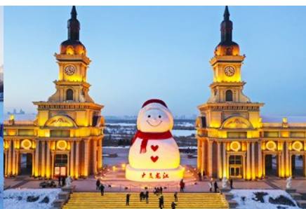
ตุ๊กตาหิมะยักษ์