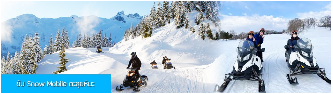
ขับ Snow Mobile ตะลุยหิมะ

รายการที่ 2 นั่ง Snow Mobile ตะลุยหิมะ 雪地摩托车 ท่านสามารถขับ Snow Mobile วิ่งตะลุยหิมะขึ้นสู่ยอดเขา ผ่านเนินเขาที่หนาแน่นด้วยหิมะ ท่ามกลางแนวป่าที่มีต้นไม้ที่มีน้ำแข็งเกาะอยู่ตามกิ่งไม้ เป็นภาพวิวธรรมชาติดูหนาวที่สวยงามน่าประทับใจและพบได้เฉพาะในฤดูหนาวทางภาคอีสานของจีนเท่านั้น เวลาที่ใช้สำหรับโปรแกรมเสริมนี้ประมาณ 1 ชั่วโมงเศษ อัตราค่าบริการ ท่านละ 380 หยวน หรือ 1900 บาท อัตรานี้รวมค่าเช่า Snow Mobile และค่าบริการของไกด์ท้องถิ่น และค่าบริการจัดการของบริษัททัวร์ท้องถิ่น หมายเหตุ โปรแกรมเสริมเป็นโปรแกรมที่ท่านต้องเสียค่าใช้จ่ายเองด้วยความสมัครใจ สำหรับท่านที่ไม่เข้าร่วมกิจกรรมดังกล่าวสามารถนั่งพักในรถได้