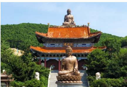
องค์พระพุทธรูปใหญ่จินตึง

พักที่ WAN HAO INTER HOTEL 4* หรือ โรงแรมในระดับเดียวกัน เมืองตุนฮว่า