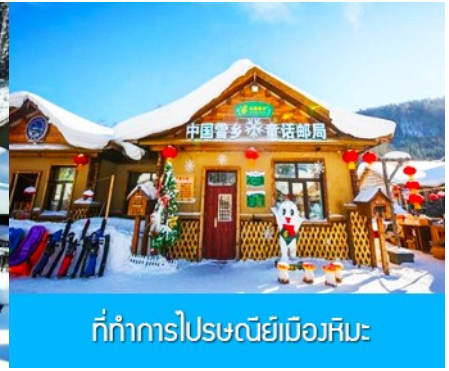
ที่ทำการไปรษณีย์เมืองหิมะ