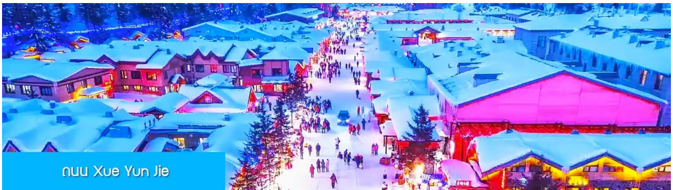
ถนน Xue Yun Jie