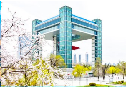
จัตุรัส ซื่อจี้