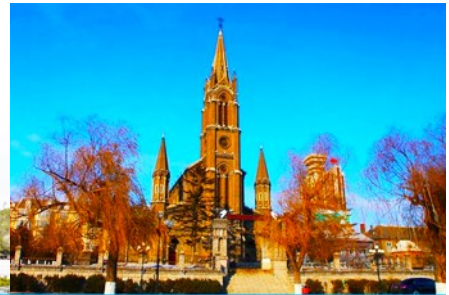
โบสถ์คอกอกอิก