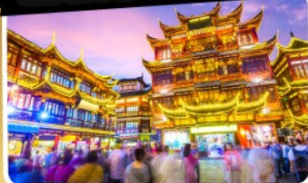
ตลาดร้อยปีเจิ้งหวงเหมียว