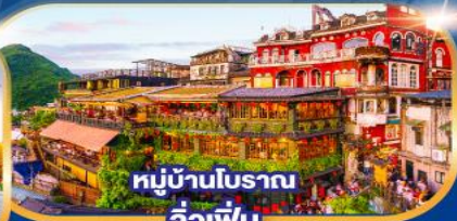
หมู่บ้านโบราณ จิวเฟิ่น