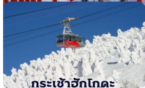
กระเช้าอีกโกดะ