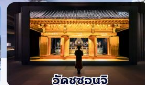
วัดชูซอนจิ