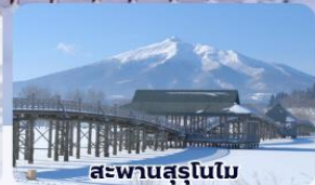
สะพานสุรุโนโม