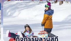
กิจกรรมลานสกี