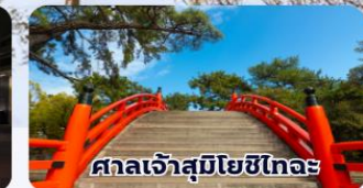
ศาลเจ้าสุมิโยชิโกะ