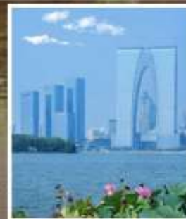
SUZHOU EAST GATE