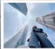
3 ดึกสูงเซี่ยงไฮ้