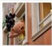
ถนนอันเป่