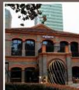
ย่านเฟิงเซินหลี่