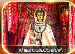
เจ้าแม่กวนอิมวัดหลินฟ้า