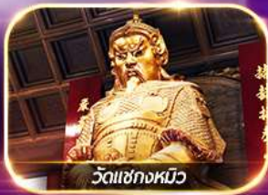
วัดเซกงหมิว