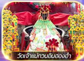
วัดเจ้าแม่ทวนอิมสองฮา