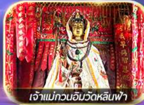
เจ้าแม่ทวนอิมวัดหลินฟ้า