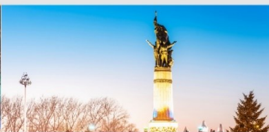
อนุสาวรีย์ฟิ่งหง