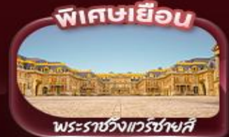
พิเศษเยือน