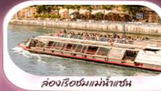
ล่องเรือชมแม่น้ำแซน