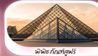
พิพิธภัณฑ์ลูฟวร์