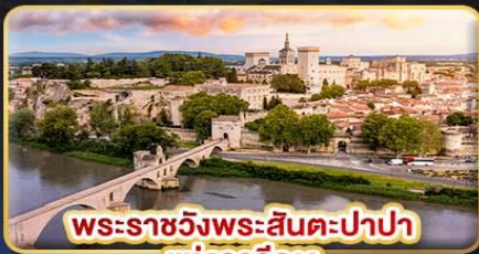
พระราชวังพระสันตะปาปา แห่งอวีญง