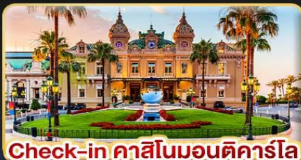
Check-in คาสิโนมอนติคาร์โล