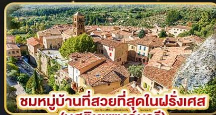
ชมหมู่บ้านที่สวยงามที่สุดในฝรั่งเศส (บูสตีเยแซงท์มารี)