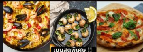
PAELLA ข้าวผัดสเปน / หอยแครงสด / พิซซ่ามาการิตต้า