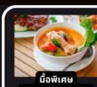
มื้อพิเศษ อาหารไทยในยุโรป