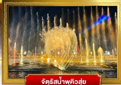
จัตุรัสน้ำพุควิสู่ย