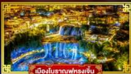
เมืองโบราณฟุรงเจิน

เที่ยว 2 เมืองโบราณ ตระกูลเมืองนิมโ "ICE & SNOW WORLD"