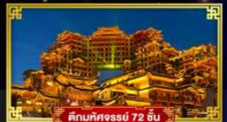
ดิคัมภีร์ 72 ชั้น