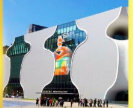
โรงละครแห่งชาติไถจง