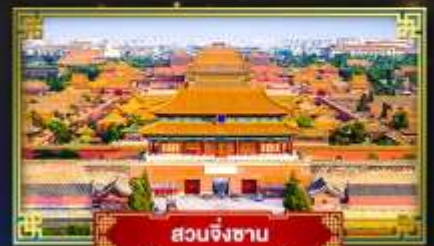
สวนจิ่งซาน