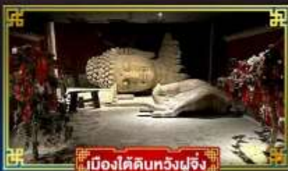
เมืองใต้ดินทวังฟูจิ่ง

“กำแพงหมื่นลิ”...สิ่งมหัศจรรย์ของโลก พระราชวังต้องห้าม อดีตพระราชวังหลวงสุดยิ่งใหญ่