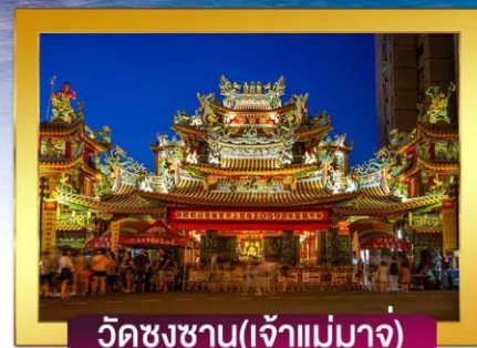
วัดชงชาน(เจ้าแม่มาจู่)