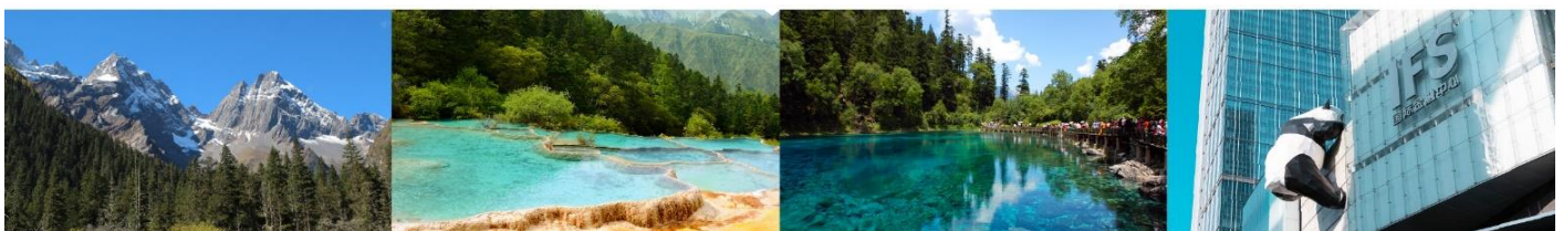
ภูเขาสี่ดรุณี อุทยานแห่งชาติหวงหลง อุทยานแห่งชาติจิวจ้ายโกว แพนด้ายักษ์ปิ่นตึก IFS