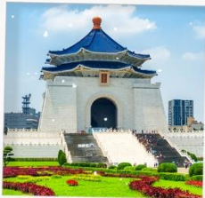
อนุสรณ์สถาน เจียงไคเชค