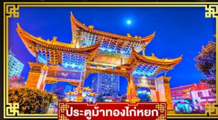
ประตูม้าทองโก่ทหยก