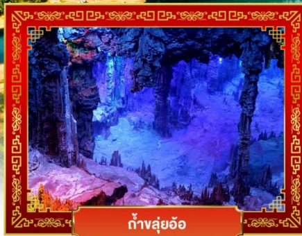
ถ้ำลู่ย้อ