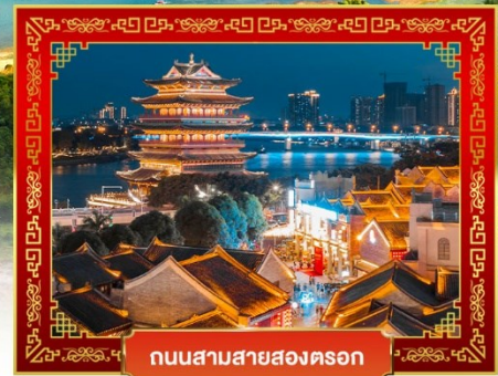
ถนนสามสายสองตอ