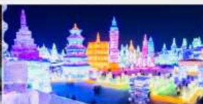
เทศกาลคอมไฟน์น้ำแข็ง