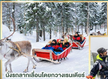
นั่งรถลากเลื่อนโดยควางเรนเดียร์