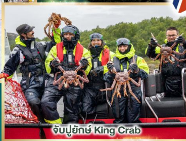
จับปูยักษ์ King Crab