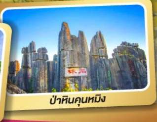
ป่าหินคุณหมิง