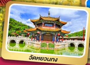
วัดหยวนกง