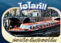
คลองเรือ อัมสเตอร์ดัม

“ตำนานเด็กยืนี่ สัญลักษณ์แห่งกรุงบรัสเซลส์ แมนเนเกน ฟิส มหาวิหารโคโลญ” สะพานไฮอินชอลเลิร์น ส่องเรือชมหมู่บ้านที่โรริน กังหันลมซานส์คัมส์ คลองอัมสเตอร์ดัม บรัสเซลส์ อะโดเมียม จัตุรัสบรูจส์ หอไอเฟล จัตุรัสคองคอร์ด พิพิธภัณฑ์ลูฟร์ ส่องเรือแม่น้ำแซน ซุปปิ้งแบบจุใจที่ห้างชั้นนำ