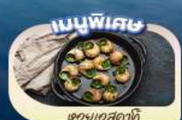
ของแถมพิเศษ

เดินทาง 9 - 16 พ.ค.68 19 - 26 พ.ค.68 26 พ.ค. - 2 มิ.ย.68