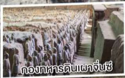
กองทัพดินเผาจิ๋นซี