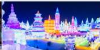
เทศกาลโคมไฟน้ำแข็ง