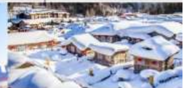
หมู่บ้านหิมะ

*ทางบริษัทฯ ขอสงวนสิทธิ์ในการสลับโปรแกรมทัวร์ตามความเหมาะสมขึ้นอยู่กับสถานการณ์หน้างาน โดยคำนึงถึงผลประโยชน์ของลูกค้าเป็นสำคัญ