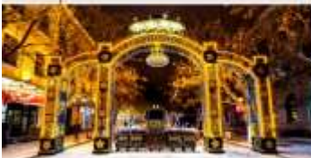
ถนนคนเดินจงหยาง