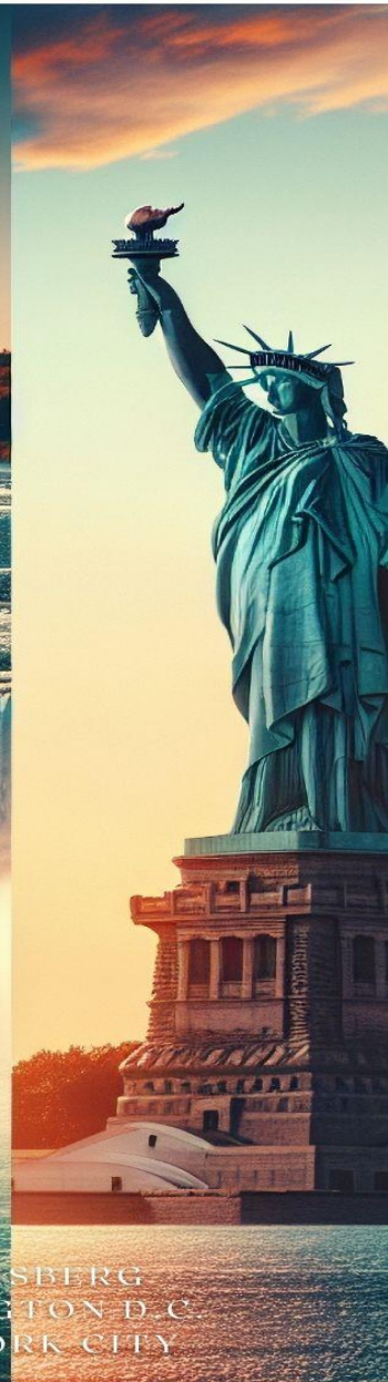
HARRISBERG WASHINGTON D.C. NEW YORK CITY