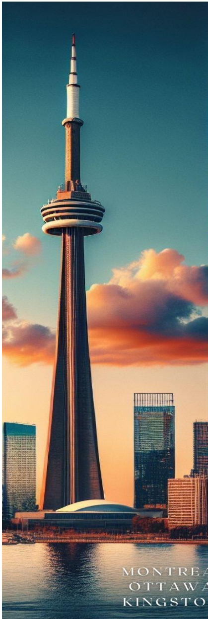
MONTREAL OTTAWA KINGSTON