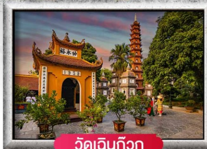
วัดเงินท้าว