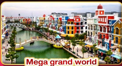
Mega grand world