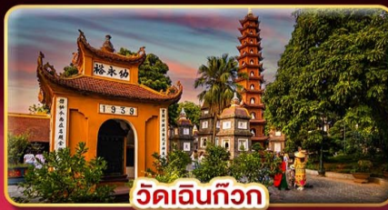
วัดเงินทิว