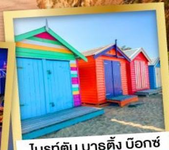
โบสถ์ดิน บาร์ตัง บ็อกซ์