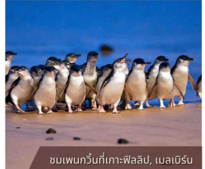
ชมเพนกวินที่เกาะฟิลลิป, เมลเบิร์น