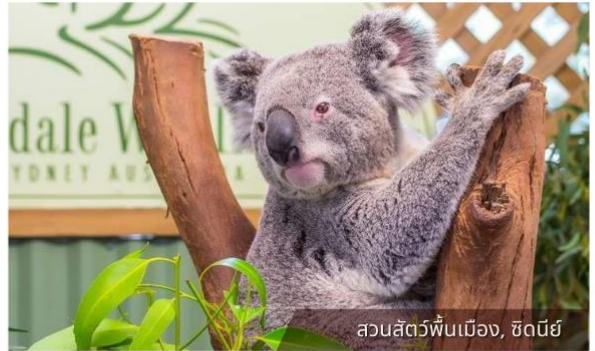
สวนสัตว์พื้นเมือง, ซิดนีย์