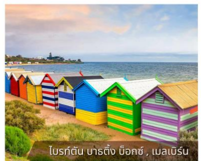
โบรด์วอล์ก บาร์ติง บ็อกซ์, เมลเบิร์น