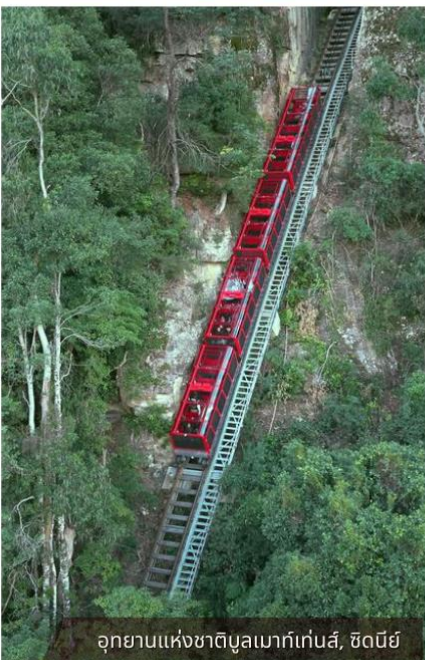
อุทยานแห่งชาติบลูเมาท์เทนส์, ซิดนีย์