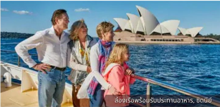
ล่องเรือพร้อมรับประทานอาหาร, ซิดนีย์