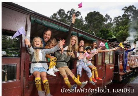
นั่งรถไฟหิวจักรไอน้ำ, เมลเบิร์น