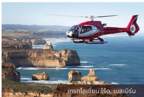
เฮลิคอปเตอร์, เมลเบิร์น