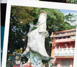
เจ้าแม่กวนอิมรพัสเบย์