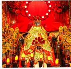
เจ้าแม่กวนอิมของฮ่า