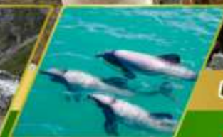
ล่องเรือชมโลมา อ่าวอาคารัว