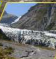
ธารน้ำแข็ง FOX GLACIER