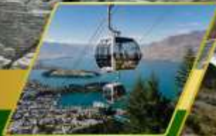
ขึ้นกระเช้าคอนโดล่า รับประทานอาหาร บนยอดเขานิวฟัน