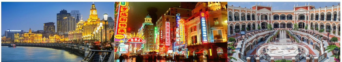
หาดไว่กาน