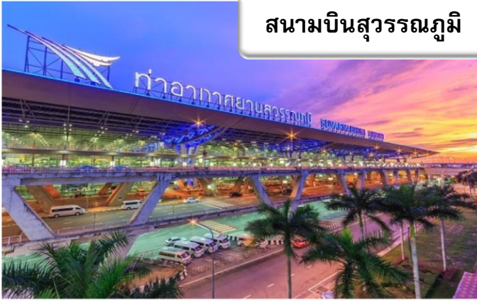
สนามบินสุวรรณภูมิ

เวลา 20.00 น. พร้อมกันที่ สนามบินสุวรรณภูมิ อาคารผู้โดยสารขาออกระหว่างประเทศเคาน์เตอร์ สายการบินไทยแอร์เวย์ เจ้าหน้าที่คอยให้การต้อนรับ ดูแลด้านเอกสาร เช็คอิน และสัมภาระในการเดินทาง