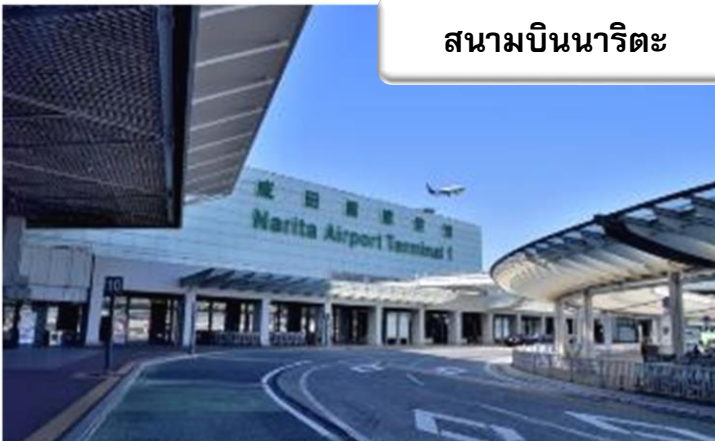
สนามบินนาริตะ

เวลา 06.20 น. เดินทางถึง สนามบินนาริตะ ประเทศญี่ปุ่น นำท่านผ่านขั้นตอนการตรวจคนเข้าเมืองและศุลกากร