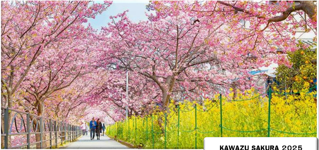
KAWAZU SAKURA 2025

คาวาซุ ซากุระ เฟสติวัล (Kawazu Sakura Festival) โดยมักจัดช่วงต้นเดือนกุมภาพันธ์ – ต้นเดือนมีนาคม ของทุกปี ซึ่งได้รับความสนใจอย่างมาก มีผู้เข้าชมมากถึง 1 ล้านคน จุดเด่นของดอกซากุระของที่นี่คือดอกมีสีชมพู และมีขนาดใหญ่พิเศษ ที่นี่มีซากุระมากถึง 8,000 ต้น