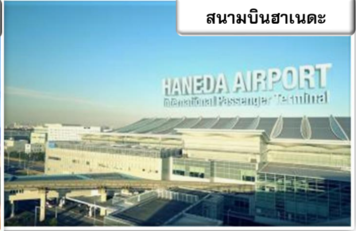
สนามบินฮาเนดะ

เวลา 20.30 น. พร้อมกันที่ ท่าอากาศยานสุวรรณภูมิ อาคารผู้โดยสารขาออกระหว่างประเทศ เคาน์เตอร์ สายการบินไทย เจ้าหน้าที่คอยให้การต้อนรับ ดูแล ด้านเอกสาร เช็คอิน และสัมภาระในการเดินทาง