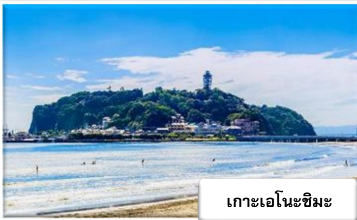
เกาะเอโนะชิมะ

เกาะเอโนะชิมะ (Enoshima) นั้นเป็นเกาะที่ลอยอยู่กลางทะเลอยู่ในเขตโซนันของจังหวัดคานากาว่า เป็นสถานที่ที่แหล่งท่องเที่ยวมากมายมารวมตัวกันอยู่ ทั้งทิวทัศน์อันงดงาม ศาลเจ้า ปรภคาร ถ้ำและอื่น ๆ อีกทั้งเมนูอาหารทะเลยังเป็นของอร่อยชื่อดังของที่นี่