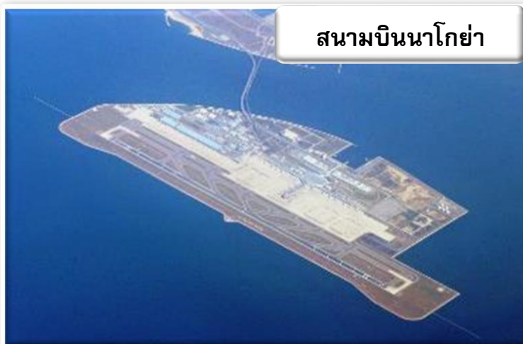
สนามบินนาโกย่า

บริการอาหารร้อนบนเครื่องพร้อมกับเมนูผลไม้สดเพื่อเติมเต็มความพิเศษไปพร้อมกับความสดชื่น