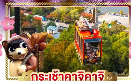
กระเช้าคาจิคาจิ