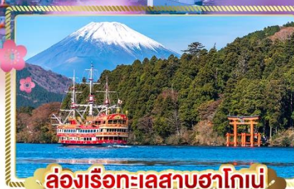
ล่องเรือทะเลสาบฮาโกเน่