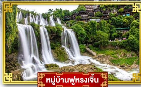
หมู่บ้านฟุทงเจิ้น