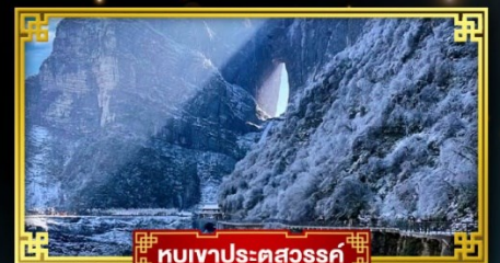
ทิวเขาประตูสวรรค์