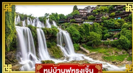
หมู่บ้านฟุรงเจิน