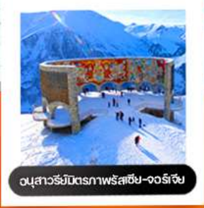
อนุสาวรีย์มิตรภาพรัสเซีย-จอร์เจีย