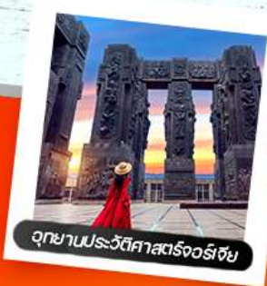
อุทยานประวัติศาสตร์จอร์เจีย