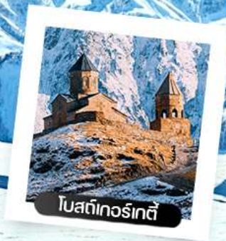
โบสถ์เกอร์เกตี