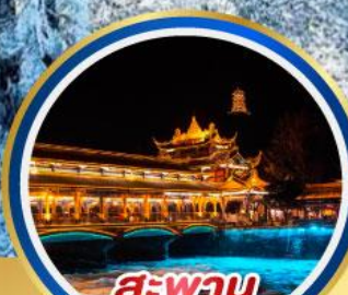
สะพาน หนานเฉียว