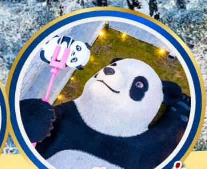
แพนด้าเซลฟ์